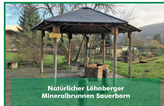
Natürlicher Löhnberger Mineralbrunnen Sauerborn

Wo: 35792 Löhnberg, Industriestraße, Natürlicher Löhnberger Mineralbrunnen Sauerborn Wann: 16.09.2018, um 10:00 Uhr Info: Bereits zum dritten Mal zeichnet der Nationale GEOPARK Westerwald-Lahn-Taunus ein „Geotop des Jahres“ aus. Im Jahr 2018 wird diese Auszeichnung aus fachlichen und sachlichen Gründen dem Natürlichen Löhnberger Mineralbrunnen Sauerborn verliehen. Die Ernennung findet im Rahmen eines Presetermins statt in dem die Infotafel und die Gabione feierlich enthüllt werden. Kontakt: Gemeinde Löhnberg, Obertorstraße 5, 35792 Löhnberg Presse- und Öffentlichkeitsarbeit, Tel.: 06471 986622