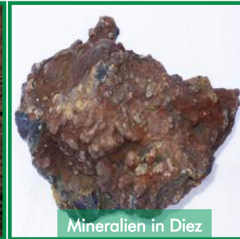
Mineralien in Diez